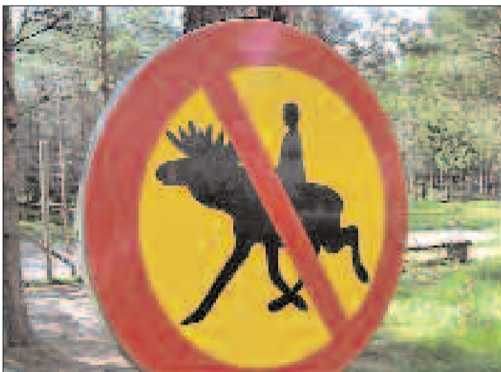
ELGRIDNING: Åride på elg er forbudt. Det artige skiltet fikk eieren av en kamerat etter at han åpnet elgfarmen i 2006.