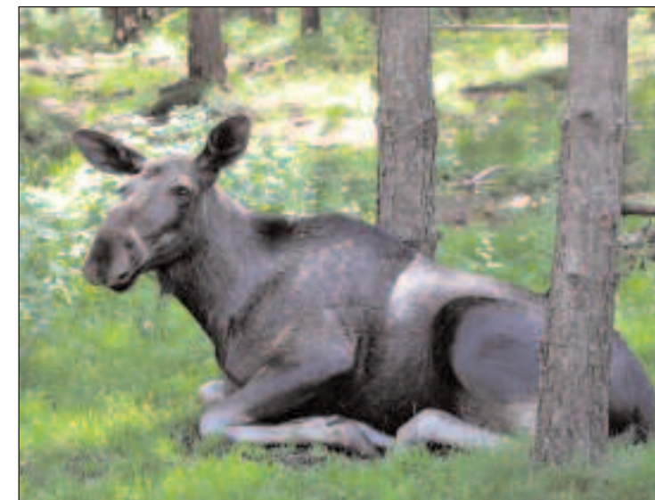
METT OG GOD: En av elgene tar seg en pust i bakken etter å ha blitt matet med blader, poteter og bananer.