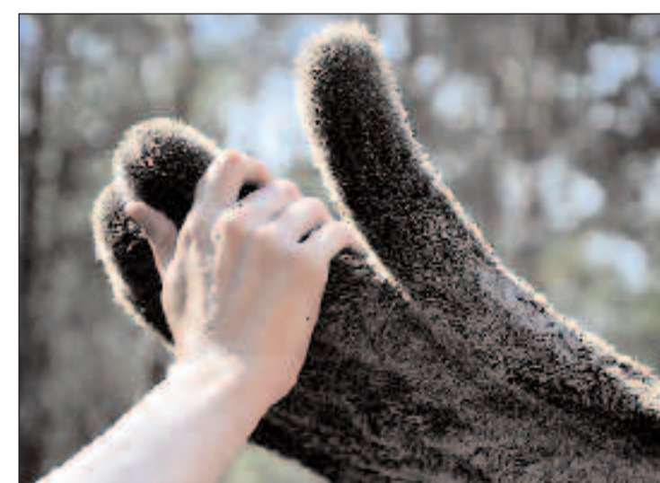
NÆRKONTAKT: Det er ikke hver dag man får kjenne på et gevir som sitter på en elg og ikke henger på en vegg.