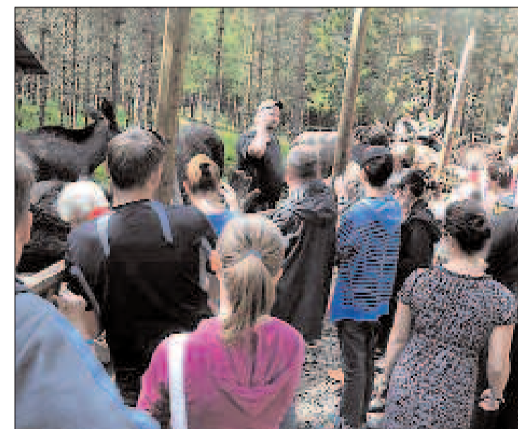
MANGE GJESTER: For publikum er det spennende å se de majestatiske dyrene på nært hold i innhegningen.