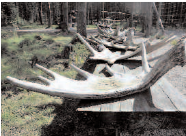
GEVIR: På elgfarmen kan du se hvordan elggevir vokser og forandrer seg fra år til år.